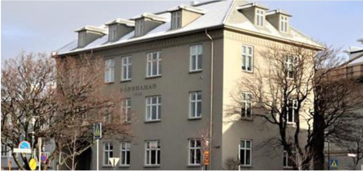
Mynd 1. Þórshamar, Templarasund 5.