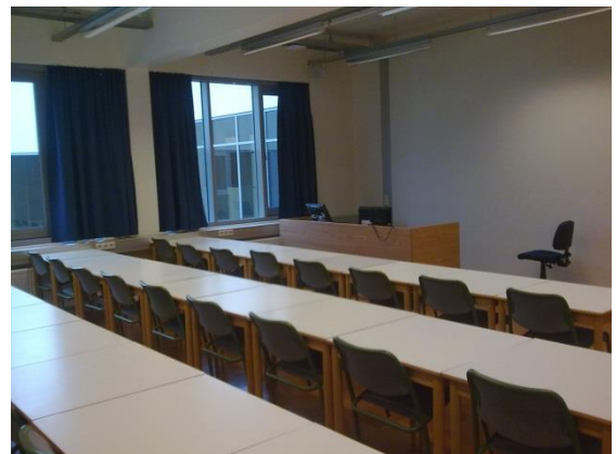
Mynd 6: Horft yfir kennslustofu

Í byrjun júní 2008 hófst verktaki handa við uppslátt fyrir sökklum, eftir að búið var að leggja nýjar fráveitulagnir úr grunninum og niður í Norðurslóð. Uppsláttur steypumóta og uppsteypa hússins stóð fram í apríl 2009, en upphafleg verkáætlun verktaka gerði ráð fyrir að uppsteypu væri lokið í árslok 2008. Að sögn verktaka voru ástæður einkum stækkun kjallara, framkvæmdir við frárennslisskurð (sem var hrein viðbót við verkið) og óhagstætt veðurfar. Haustið 2008 og veturinn 2008-2009 var veður mjög umhleyplingasamt með frosti og snjó sem setti strik í reikninginn. Innanhúss vinna hófst í febrúar 2009 með pípulögnum og málningarvinnu í kjallara. Farið var að reisa léttu innveggi úr stálgrindum með gifsklæðningum í maí. Raflagnavinna innanhúss hófst á sama tíma. Sumarið og haustið 2009 var unnið inni við klæðningu lofta, smíði gifsveggja, pípulagnir, loftræslagnir, raflagnir, sandspörsun og málun.