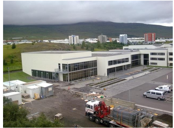
Mynd 1: Háskólinn á Akureyri

Frumathugun var unnin af Glámu-Kím arkitektum. Niðurstöður forathugunar vegna uppbyggingar Háskólans á Akureyri lágu fyrir með niðurstöðu samkeppni um framtíðarþróun að Sólborg við Norðurslóð.