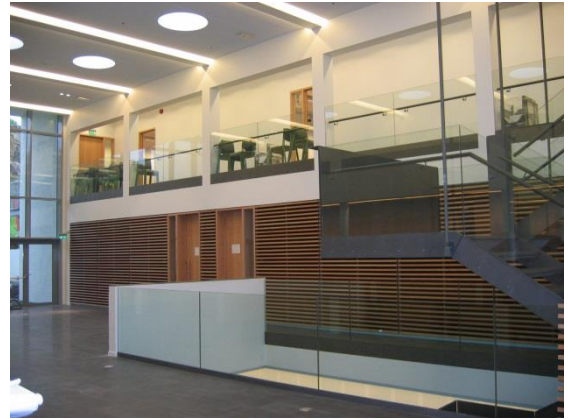
Mynd 2: Háskólinn á Akureyri, gangur

Þar sem virðisaukaskattur fæst endurgreiddur af hönnunarbókun eru fjárhæðir í töflunni settar fram án VSK eins og í reikningslegu uppgjöri í kafla 3.