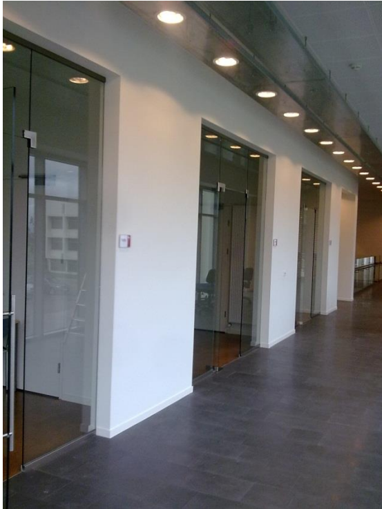
Mynd 7: Horft inn eftir gangi

gólfin í hátíðasölunum, en því var breytt í sparnaðarskyni. Unnið var af krafti við innanhússfrágang, hljóðvistarklæðningar, loftaklæðningar, málun, innihurðir, stálstiga, gólfefni, innréttingar o.fl. vorið og sumarið 2010.