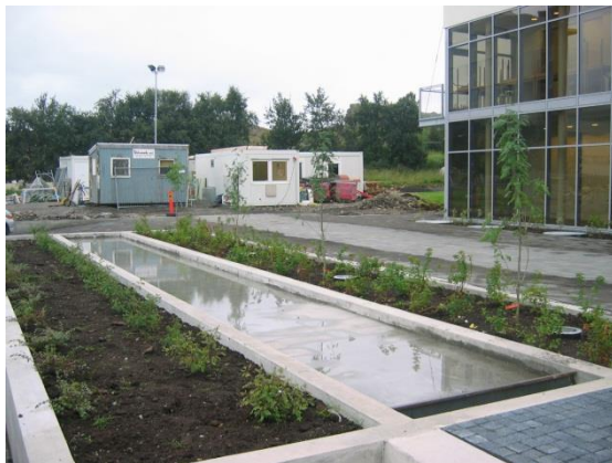
Mynd 5: Séð yfir spegiltjörn við aðalinngang

Verksamningur var undirritaður á verkfundi 14. febr. 2008 og hófust verklegar framkvæmdir fljótlega eftir það. Jarðvinnuverktaki hóf útgröft úr grunni þann 27. febrúar 2008.