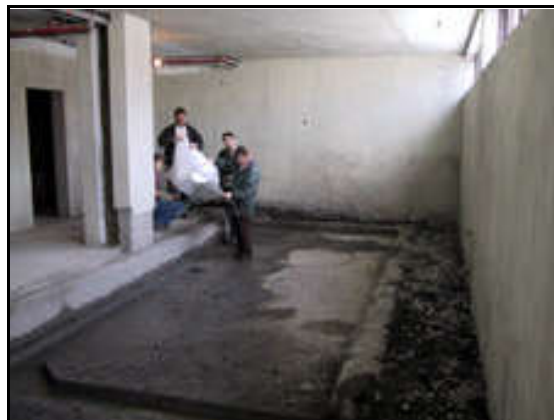
Búið að fjarlægja steyppta sundlaug