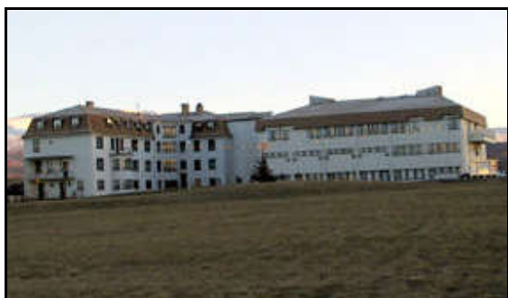
Sjúkrahúsið á Blönduósi

Hér verður gerð grein fyrir framkvæmdum við Heilbrigðisstofnunina á Blönduósi, breytingar í kjallara og á 2. hæð. Framkvæmdin tók til breytinga og innréttinga rýma í sjúkrahúsinu fyrir sjúkraþjálfun og kistulagningu í kjallara svo og fæðingastofur á 2. hæð ásamt aðstöðu fyrir ljósmóður, samtals 356 m 2 .