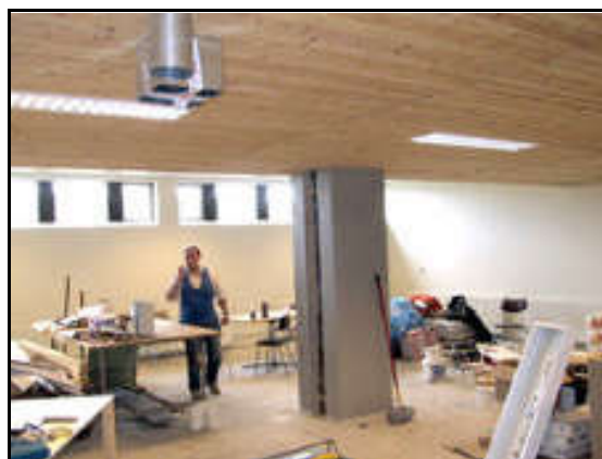
Vinna í sjúkrahjálfunarrými

Það kom strax í ljós að mikið ósamræmi og margar villur voru í útboðsgögnum. Endanlegt uppgjör við verktaka var kr. 26.307.351 og þar af voru aukaverk að upphæð kr. 1.866.398 eða um 7% af samningsfjárhæð.