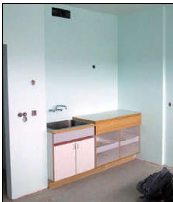
Innrétting í fæðingarrými.