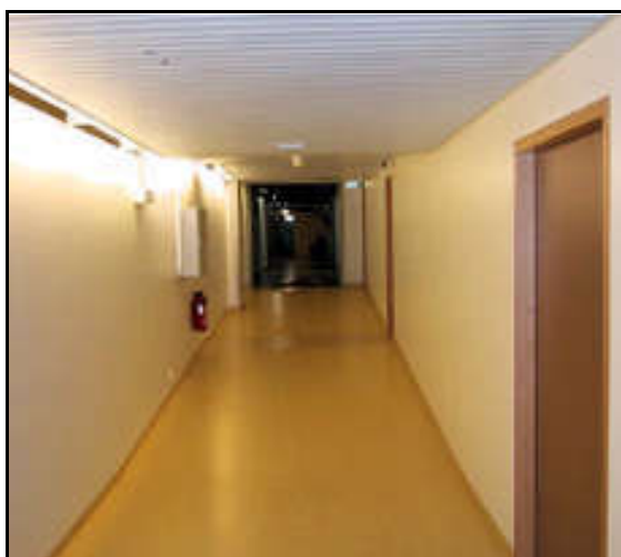
Gangur að loknum framkvæmdum.