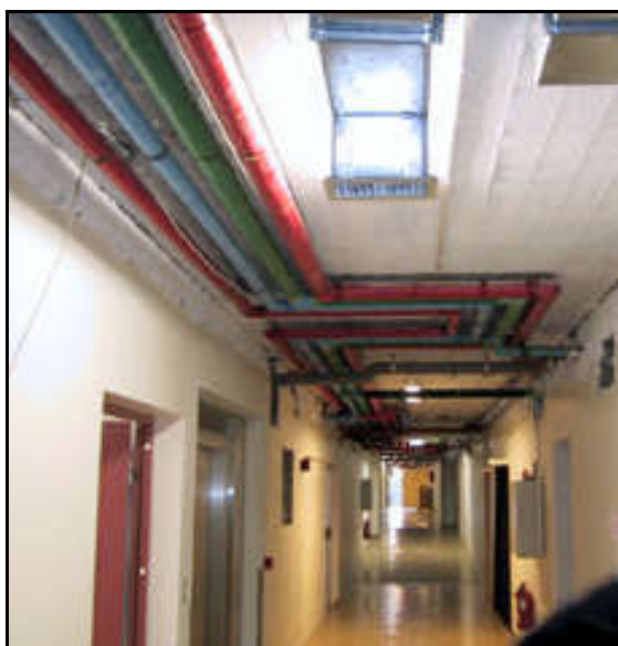
Gangur áður en framkvæmdir hófust.