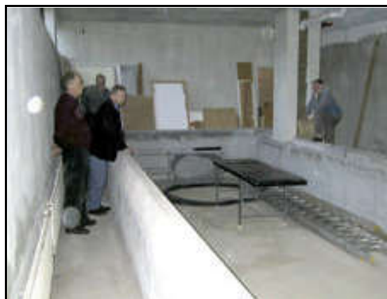
Steypt sundlaug sem fyrir var