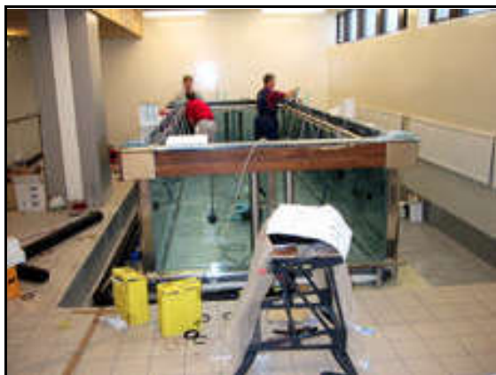
Sænskir aðilar sáu um uppsetningu sundlaugarinnar.