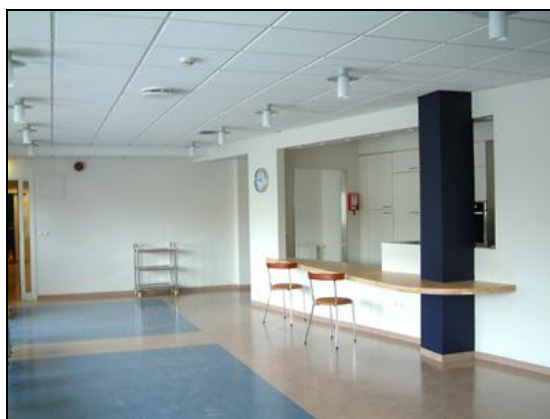
Eldhús og matsalur.

Í reikningslegu uppgjöri í töflu 3.2 er gerð grein fyrir magnaukningum, aukaverkum og viðbótarverkum.