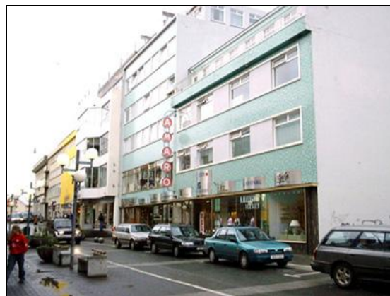
Hafnarstræti 99-101. Akureyri.