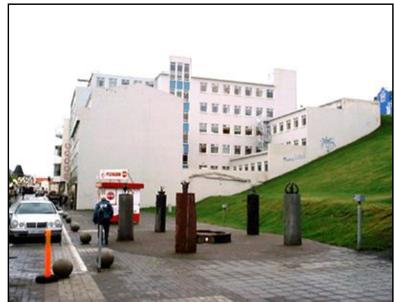
Hafnarstræti 99-101, norðurhlið.

Fjárhagslegur árangur í heild telst góður.