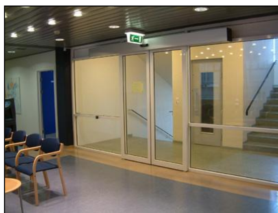
Hurð út í stigagang að lyftu.