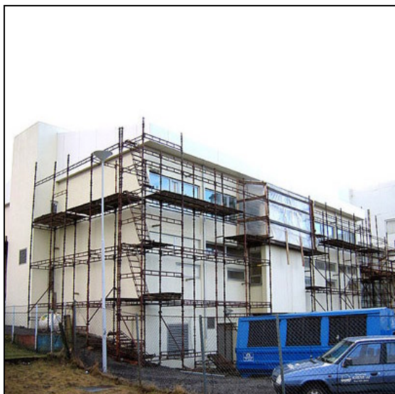
Unnið að utanhússfrágangi.