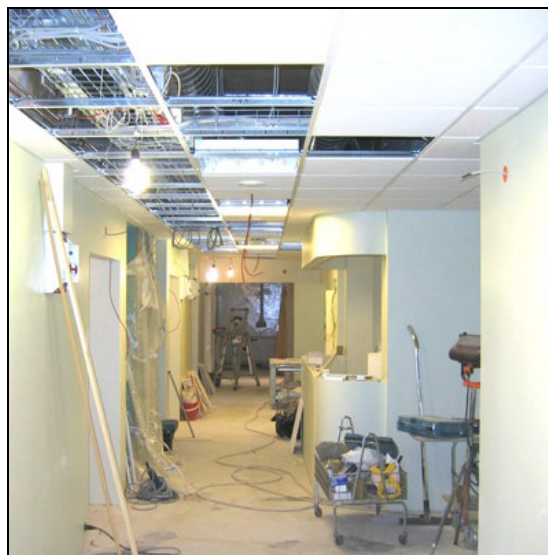
Gangur fæðingadeildar í endursmiði.

Heildarkostnaðaráætlun hefði samkvæmt því átt að vera kr. 173, 2 m.kr.