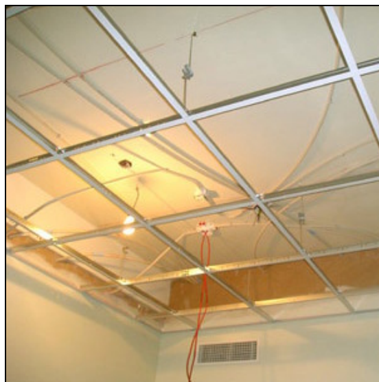
Unnið við loft.