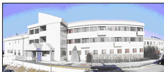
Sjúkrahúsið á Akranesi.

Á grundvelli fyrri athugana var unnið að hönnun á nauðsynlegum endurbótum og breytingum á fyrrnefndum svæðum á 1. hæð, eldhúsi og á 2. hæð, fæðingardeild norðurálmú. Hönnuð var endurnýjun á sótthreinsun sem flutt var í kjallara hússins en var áður á 2. hæð. Hannaðar voru endurbætur og endurnýjun á öllum innréttingum beggja hæða. Allar sjúkrastofur voru endurnýjaðar og nánast allt í eldhúsi á 1. hæð. Fastar innréttingar náðu til endurnýjunar innveggja og hurða, lofta og gólfefna, allra láréttra hita- og vatnslagna ásamt öllum raflögnum. Loftræsilagnir voru endurnýjaðar sem og öll brunahólfun milli rýma og hæða á því svæði sem verkið náði til.