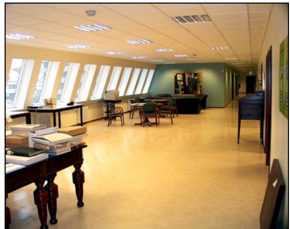
Salur. Horft í suður