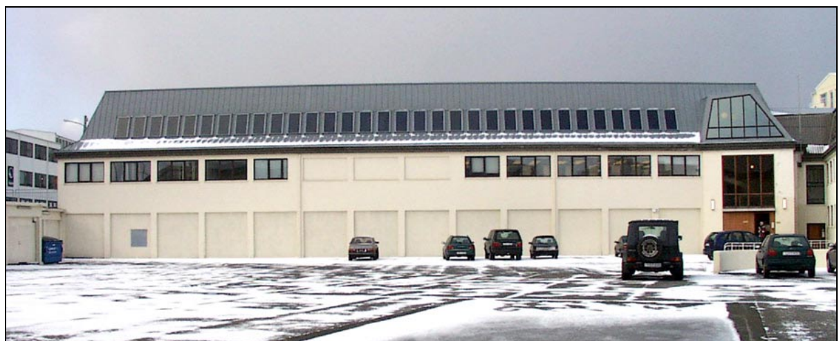
Austurhlíð húss 2