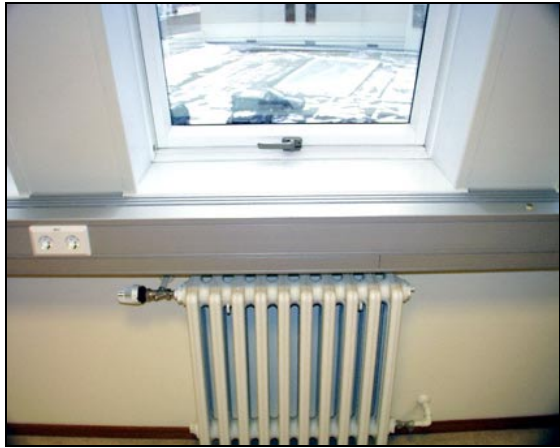
Nýr þakgluggi og rafmagnsrenna. Ofnar voru notaðir áfram en hitalagnir voru endurnýjaðar