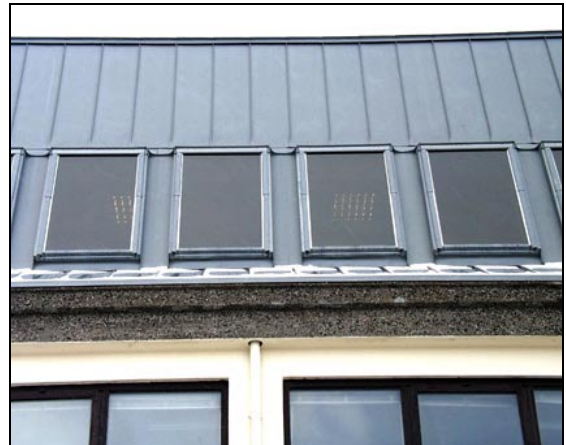
Ný þakklæðning og þakgluggar

Vertaki fór fram á að smíða svokallaðan “fjárлагaglugga” hér á landi. Eftir yfirferð þess máls með hönnuði og framleiðanda var fallist á þessa beiðni þótt vottun gluggans lægi ekki fyrir.