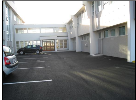
HSS að framkvæmdum loknum.

Fjárhagslegur árangur verksins var góður.