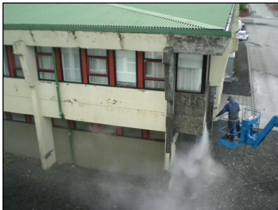
Hápvottur hafinn við B-byggingu.

Útboðsverkið hófst ekki fyrr en komið var framundir haust en verkið gekk mjög vel eftir það og lauk því með verklokaúttekt þann 27. maí 2009. Vinna við málun hófst 15. apríl 2009 og lauk þann 22. júlí 2009.