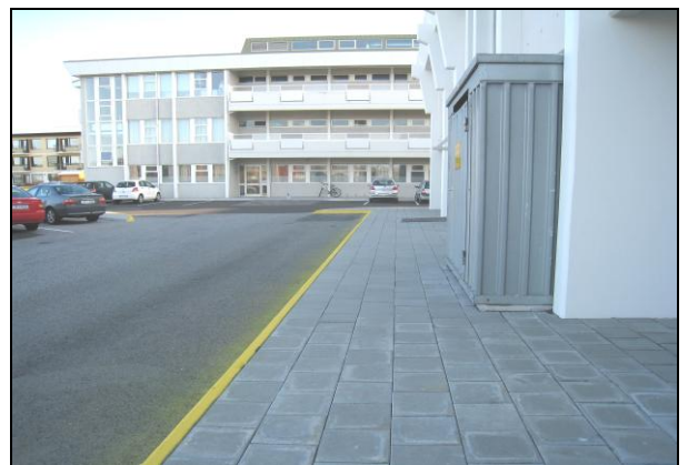
Frágangi og málun lokið.

Verklokaúttekt fór fram 22. júlí 2009 með smávægilegum athugasemdum sem lokið var við þann 28. júlí 2009.