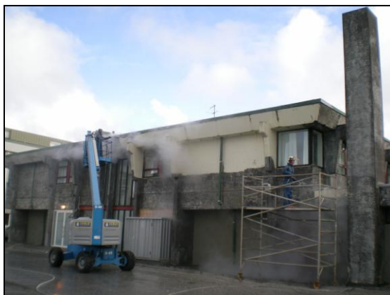
Háprýstipvottur. Verkið gekk vel.