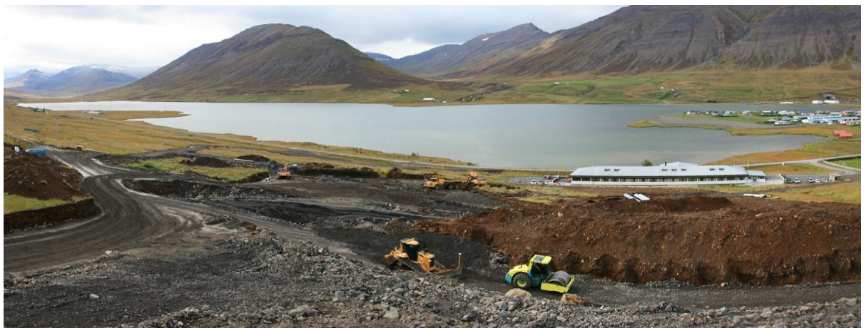
Mynd 5: Ljósmynd, Gisli Kristinsson

Aukaverk verðbætur og hækkun vegna hækkunar á VSK úr 24,5% í 25,5% nemur samtals 4.031.232,- kr.