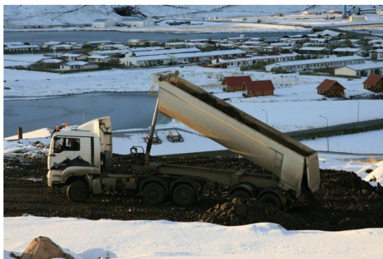
Mynd 1: Frá verkstað, ljósm. Gísli Kristinsson

Í þessu skilamati verður gerð grein fyrir Snjóflóðavörnum við Hornbrekku, Ólafsfirði sem framkvæmdar voru á árunum 2009-2010 við uppbyggingu garðana en sáning og uppgræðsla stóð yfir frá 2010-2013.