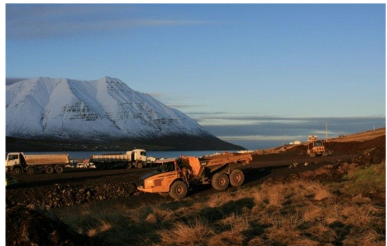
Mynd 6: Ljós. Gísli Kristinsson

Heildar kostnaðaráætlun hönnuða á yfirborðsfrágangi og uppgræðslu var 20.861.325,- kr.