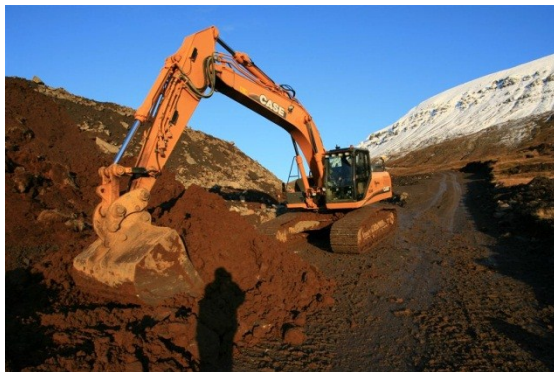
Mynd 2:

Þar sem virðisaukaskattur fæst endurgreiddur af hönnunarþöknun eru fjárhæðir í töflunni settar fram án VSK eins og í reikningslegu uppgjöri í kafla 3.