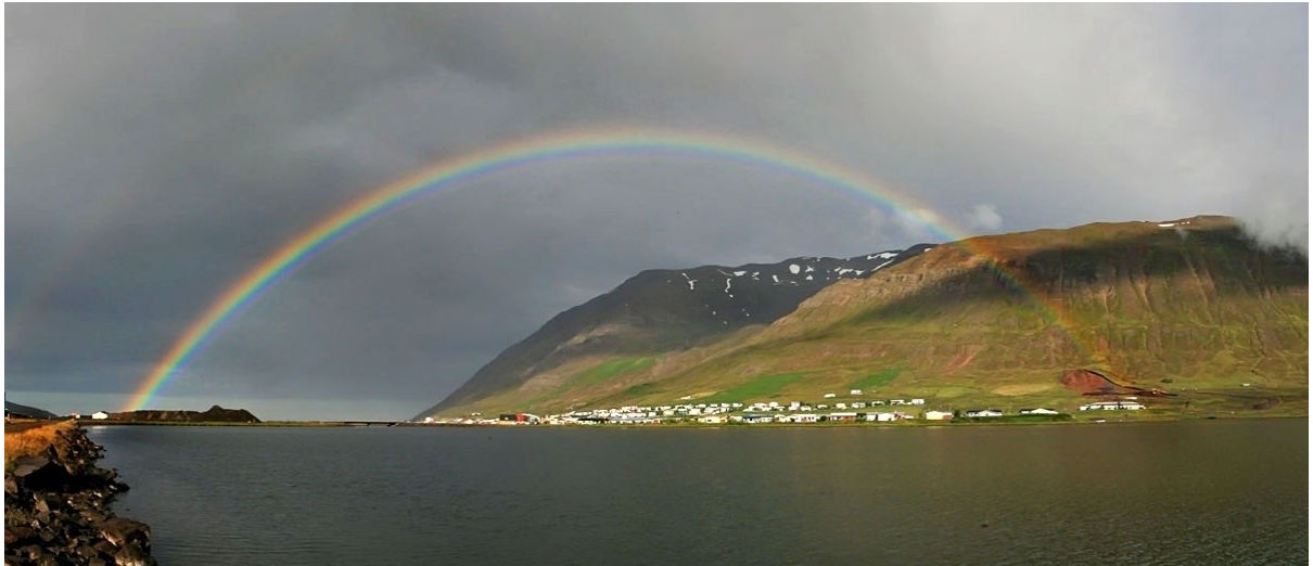
Mynd 4: