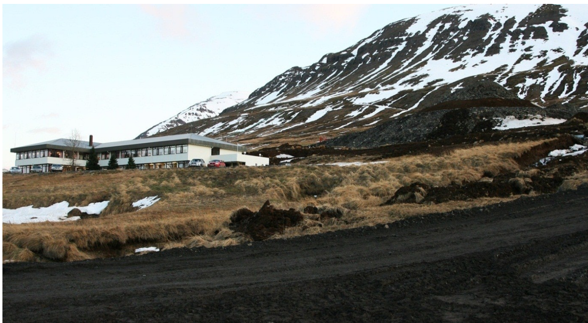
Mynd 7: