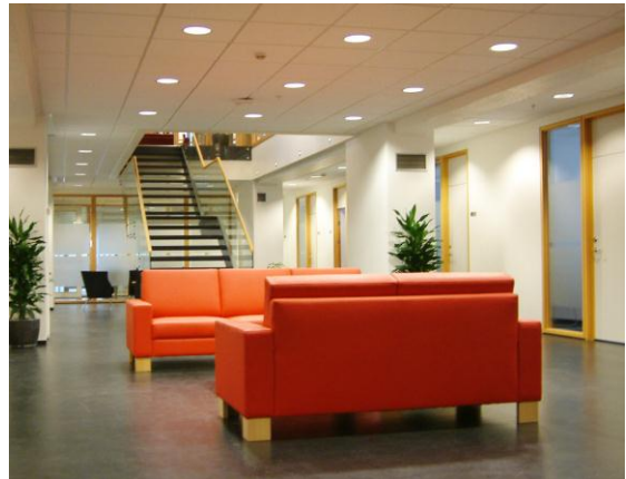
Stigi milli 2. og 4. hæðar Sölvhóls götu 7.