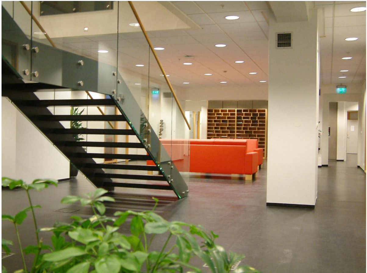
Stigi milli 2. og 4. hæðar innanríkisráðuneytisins að Sölvhólsgötu 7.