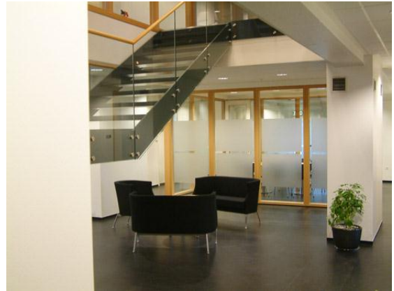
Á 3. hæð við stigann.

Mismunur upphæðanna skýrist í meginatriðum á tæplega 2 m.kr. vegna magnbreytinga og tæplega 7 m.kr. viðbótarverka vegna aukinna aðgerða út af brunatæknilegum kröfum til verksins s.s. vatnsúðakerfi á einni hæð, lagfæringu á loftræsingu að nýju stigahúsi og eldhólfandi hurðir og veggir á 2. hæð.