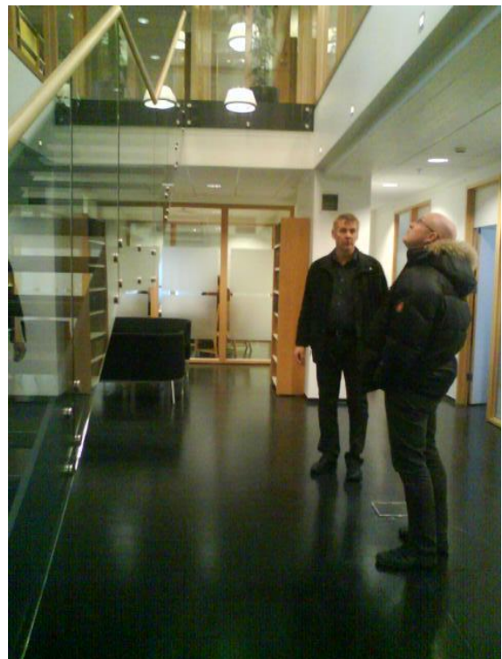
Opið á milli hæða við stigann.