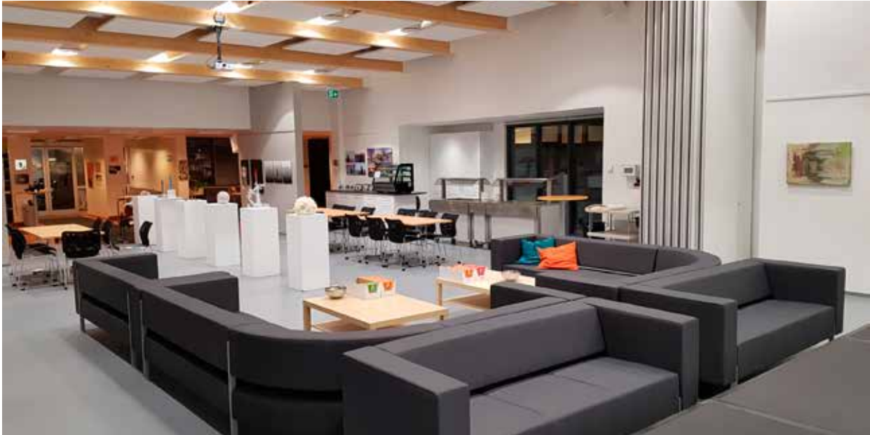
Mynd 2. Fjölnotasalur.