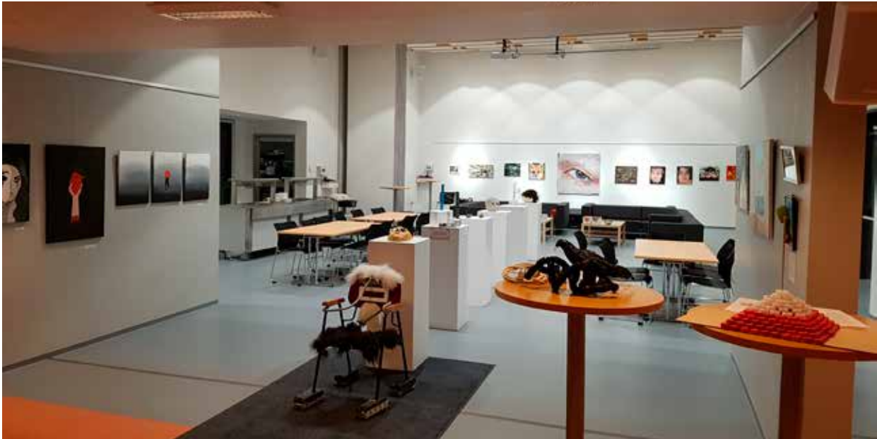
Mynd 7. Séð inn eftir fjölnotasalnum.