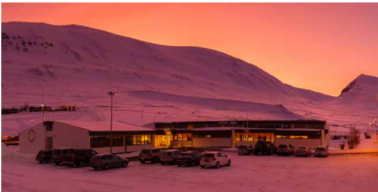
Mynd 5. Menntaskólinn á Tröllaskaga.