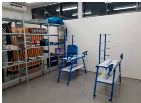
Mynd 4. Geymsla.