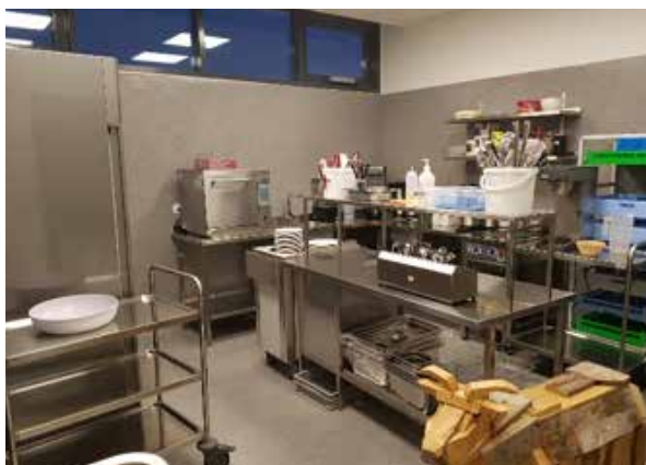
Mynd 3. Móttökueldhús.