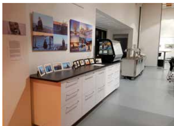
Mynd 6. Geymsla.