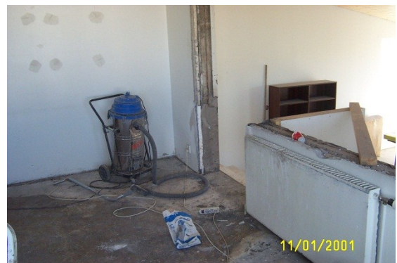
Mynd 5: Á framkvæmdatíma

Samkvæmt verksamningi voru verklok áætluð 20. ágúst 2007. Hafist var handa við verkið 15. febrúar sama ár. Var þá byrjað á því að rífa gamlar klæðingar og í framhaldi af því var grafið frá húsinu og sökklar steiptir upp undir samnotasal og baðaðstöðu. Viku síðar var byrjað á breytingum á skrifstofuhúsnæði en þeirri vinnu var að mestu lokið í júní. Uppsteypu á viðbyggingum sem hýsa baðherbergi og samnotarými var lokið í byrjun júní. Í byrjun mars hófst vinna við breytingar á suðurenda fangelsisbyggingar og voru herbergin að mestu fullfrágengin í júnílok.