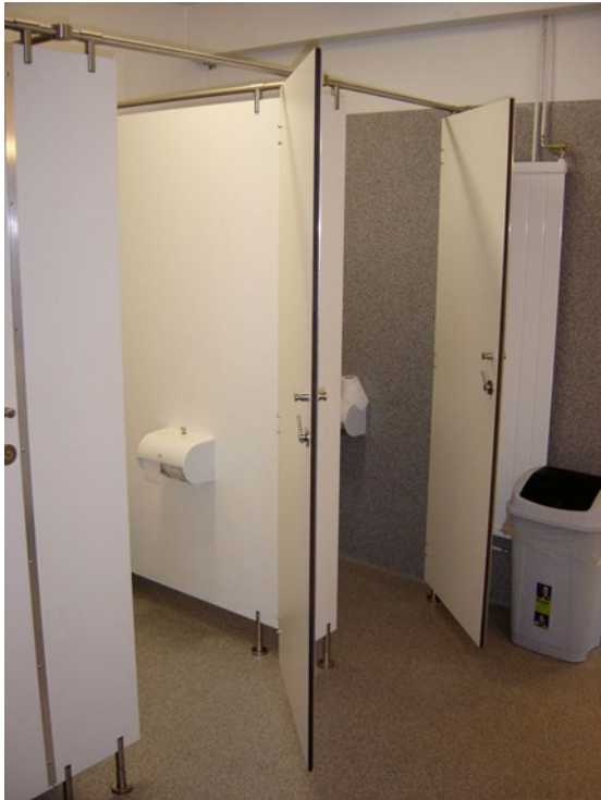
Mynd 6: Endurbætt hreinlætisaðstaða

Nokkur seinkun var orðin á framkvæmdum um miðjan maí og má meðal annars rekja það til óhagstæðs veðurfars frá verkbyrjun. Á verkfundi 15. maí fór verktaki fram á framlengingu vegna ýmissa breytinga á verkinu, ósamræmis á teikningum og tafa á afhendingu teikninga í upphafi verks og breyttum teikningum í byrjun maí. Fallist var á alls 9 daga framlengingu á verkinu vegna tafa í upphafi verks og vegna breytinga og bið eftir ákvörðun á hæðarlegu veggja í viðbyggingum.