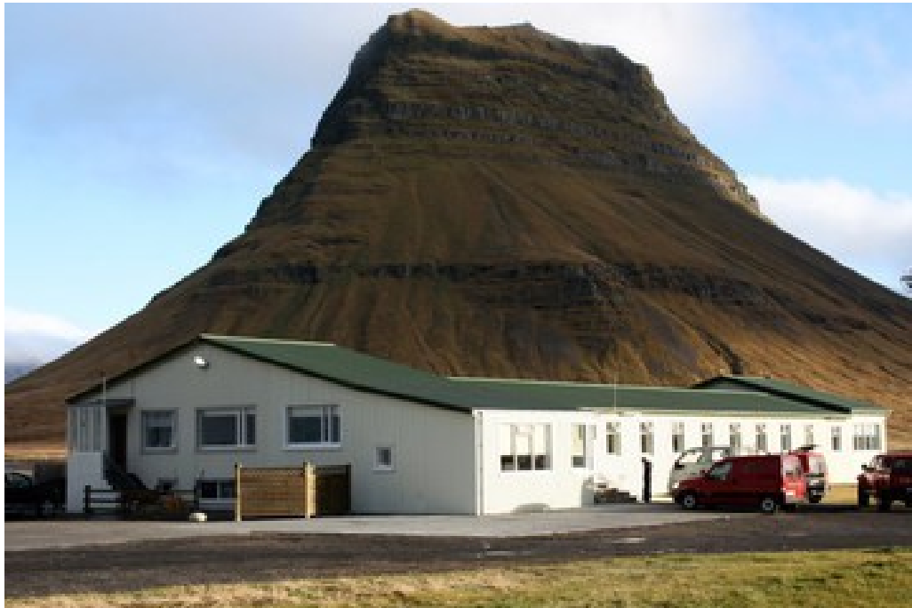
Mynd 10: Kvíabryggja eftir breytingar

Stuðullinn verður því einn ef engin viðbótarverk eru framkvæmd og hann verður stærri en 1 ef stofnað er til viðbótarverka við framkvæmd verksins. Þessi stuðull getur orðið minni en einn ef verkkaupi tekur ákvörðun um að breyta verki til kostnaðarlækkunar, t.d. með því að gera minni kröfur til fyrirskrifaðs efnis eða útfærslu.