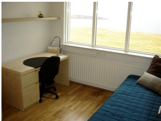
Mynd 8: Aðstaða vistmanna

Viðbótarverk námu alls 2.818 þús. kr. Breyting á gólfefnum nam alls um 1.200 þús.kr. en parket var valið í stað dúks og flísa í vaktherbergi og nokkrum rýmum í suðurenda fangelsisbyggingarinnar. Valið var að breyta fyrirskrifuðu efnis í gluggakörmum og bæta við opnanlegum fögum í gluggum og öryggisgleri að fjárhæð um 420 þús.kr. Kostnaður við frágang á lóðinni nam um 450 þús.kr. og auk þess var ýmislegt annað gert til endurnýjunar í lögnum, hreinlætistækjum, raflögnum og frágangi utan- og innanhúss sem ekki hafði verið gert ráð fyrir í útboðsgögnum.