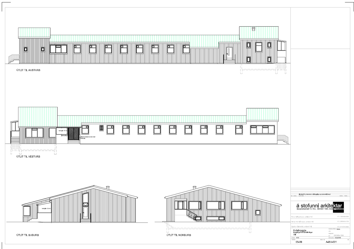
Mynd 3: Útlit