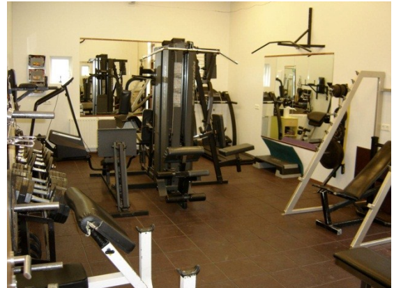
Mynd 9: Æfingasalur

Með bréfi þann 2. febrúar 2007 kæra Blómvellir ehf. afgreiðslu FSR á útboðinu aðallega vegna dráttar á samþykki tilboðs lægstbjóðanda en 7 vikur liðu frá opnun tilboða þar til tilboðið var formlega samþykkt. Kærufélag útboðsmála hafnaði kröfu kæranda.