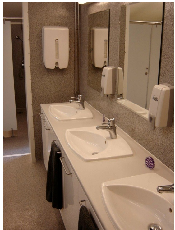
Mynd 7: Endurbætt hreinlætisaðstaða

Þó nokkuð ósamræmi var í útboðsgögnum og má rekja góðan hluta auka- og viðbótarverka til þess, en gleymst hafði að setja í verklýsingu og í magnskrá ýmislegt sem fram kom á teikningum eða sem reiknað var með að kæmi. Einnig vantaði ýmislegt í gögn sem í ljós kom við rif og breytingar til undirbúnings verksins. Þá bar einnig á því að ekki gekk almennilega upp að framkvæma sumt samkvæmt teikningum og útboðsgögnum.