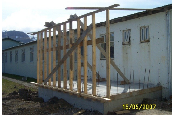
Mynd 4: Á framkvæmdatíma

Í auglýsingu útboðsverksins segir meðal annars að um óhefðbundið útboð sé að ræða, þar sem bjóðendur fá afhentar aðalteikningar arkitekta og sérteikningar. Það kemur svo í hlut verktaka að sjá um alla aðra hönnun sem þörf er á.