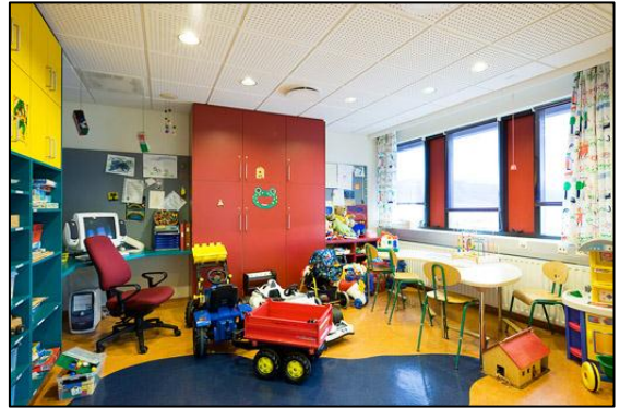
Leikherbergi í barnadeild.

Eftir að barnadeildin var tekin í notkun komu fram mörg auka- og viðbótarverk sem verk-taka var falið að vinna og sem nauðsynlegt var að framkvæma til að hægt væri að taka barna-deildina í notkun eins og áður hefur komið fram. Samtals námu auka- og viðbótarverk til Hyrnu ehf. um 41,3 m.kr. á árunum 1999-2001.