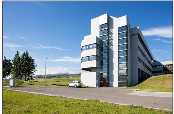
Fjórðungssjúkrahúsið á Akureyri, Suðurálma.

Að auki er kjallari fyrir lagnakerfi, geymslur og búningsklefa starfsfólks, tæknirými í þakhýsi og stigahús með lyftu að austan sem tengir allar hæðir Suðurálmu.