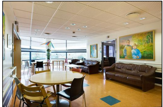
Setustofa í barnadeild.