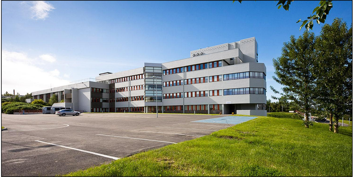
Sjúkrahúsið á Akureyri, Suðurálma.

Við mat á árangri framkvæmdanna hefur verið gerð grein fyrir fjárhagslegum þáttum en líta ber einnig til annarra þátta. Miklar tafir urðu á undirbúningi sem stöfuðu öðru fremur af töfum á fjármögun. Eftir endurskoðun hönnunar var tekið mið af þörfum sem þá voru uppi.