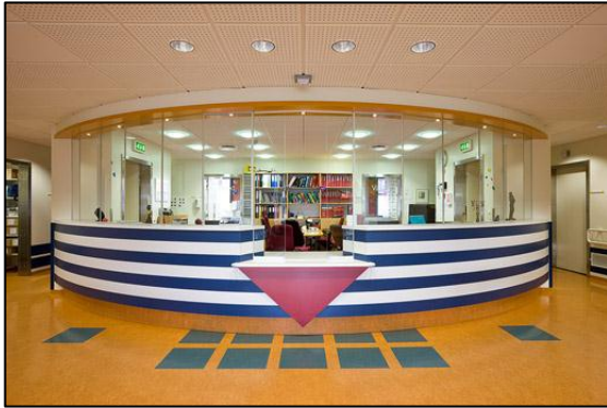
Móttaka í barnadeild.