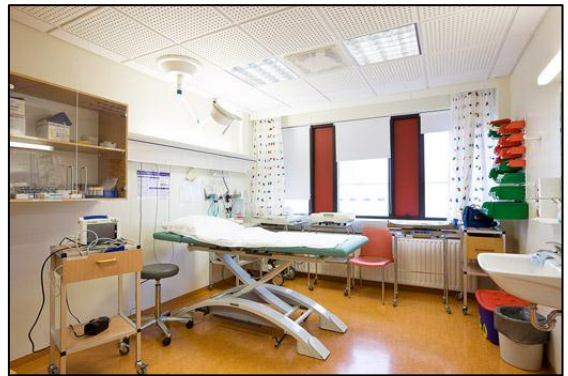
Meðferðarherbergi í barnadeild.

Eftir að barnadeildin var tekin í notkun komu fram mörg auka- og viðbótarverk sem verk-taka var falið að vinna og sem nauðsynlegt var að framkvæma til að hægt væri að taka barna-deildina í notkun eins og áður hefur komið fram. Samtals námu auka- og viðbótarverk til Hyrnu ehf. um 41,3 m.kr. á árunum 1999-2001.