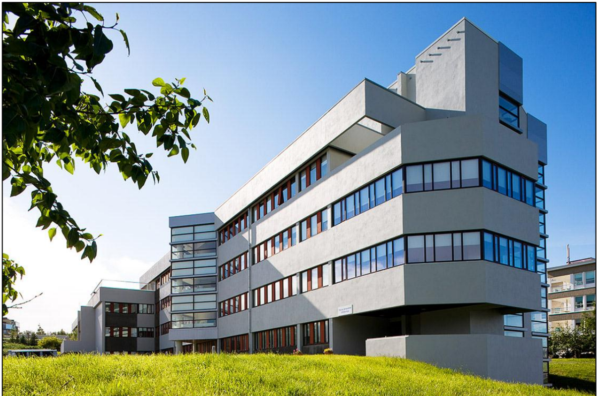
Fjórðungssjúkrahúsið á Akureyri. Suðurálma.