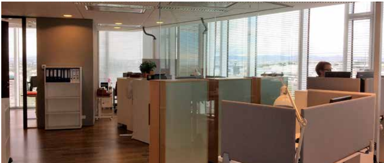
Mynd 2. Úr opnu vinnurými.