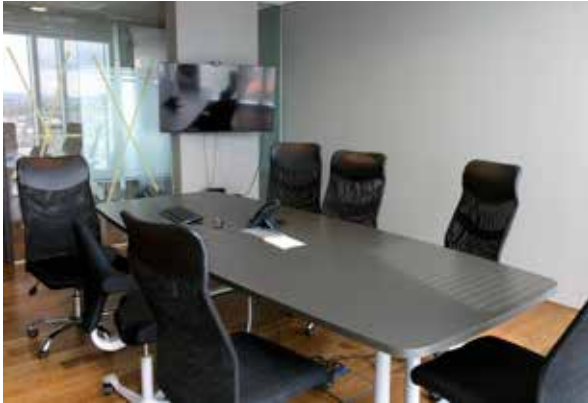
Mynd 5. Úr fundarherbergi.

velferðarráðuneyti. Endanleg stærð þess leigða er 346 m 2 , þar af er séreign 270 m 2 og sameign 76 m 2 .