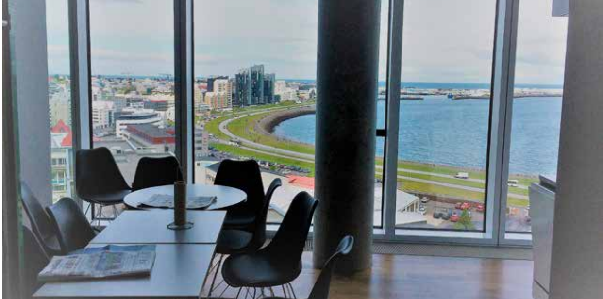
Mynd 1. Útsýni úr kaffiástöðu starfsmanna.