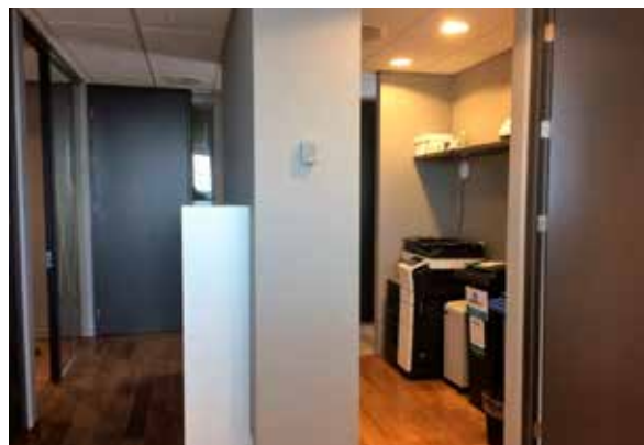
Mynd 4. Vinnurými.

Ríkiskaup auglýsti í október 2016, fyrir hönd ríkissjóðs, eftir 280 m 2 húsnæði til 10 ára fyrir úrskurðarnefndina. Einungis tvö tilboð bárust og voru þau bæði metin hæf til nánari skoðunar. Tilboði frá HTO ehf. var tekið og er þar um að ræða húsnæði á 11. hæð í Tuminum að Katrínartúni 2, 105 Reykjavík.