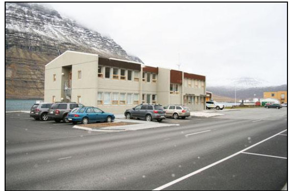
Viðbygging sýsluskrifstofunnar á Eskifirði