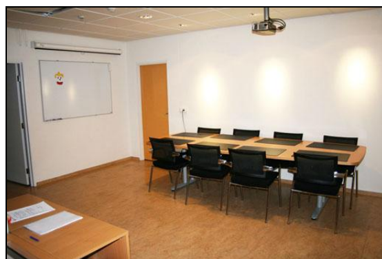
Skrifstofa með fundaaðstöðu.

Fjárhagslegur árangur í heild er hagstæður.