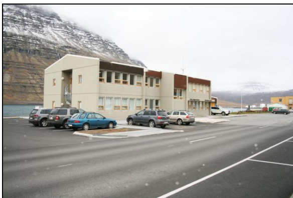
Sýsluskrifstofan við lokaúttekt.

Ákveðið var vegna ytri aðstæðna að verktakinn fengi tímann fram á ábyrgðaukttekta verksins til að ljúka endanlega við verksamningsskyldur sínar.