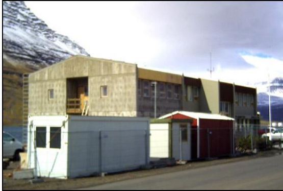
Uppsteypu lokið í júní 2007.

Þetta hefur þær breytingar í för með sér að verktími lengdist. Var ný tímaáætlun samþykkt á verkfundi 25. júní þar sem gert var ráð fyrir verklokum í byrjun ágúst 2007. Engin aukagreiðsla eða aukakostnaður átti að falla á verkkaupa vegna þessa breytinga.