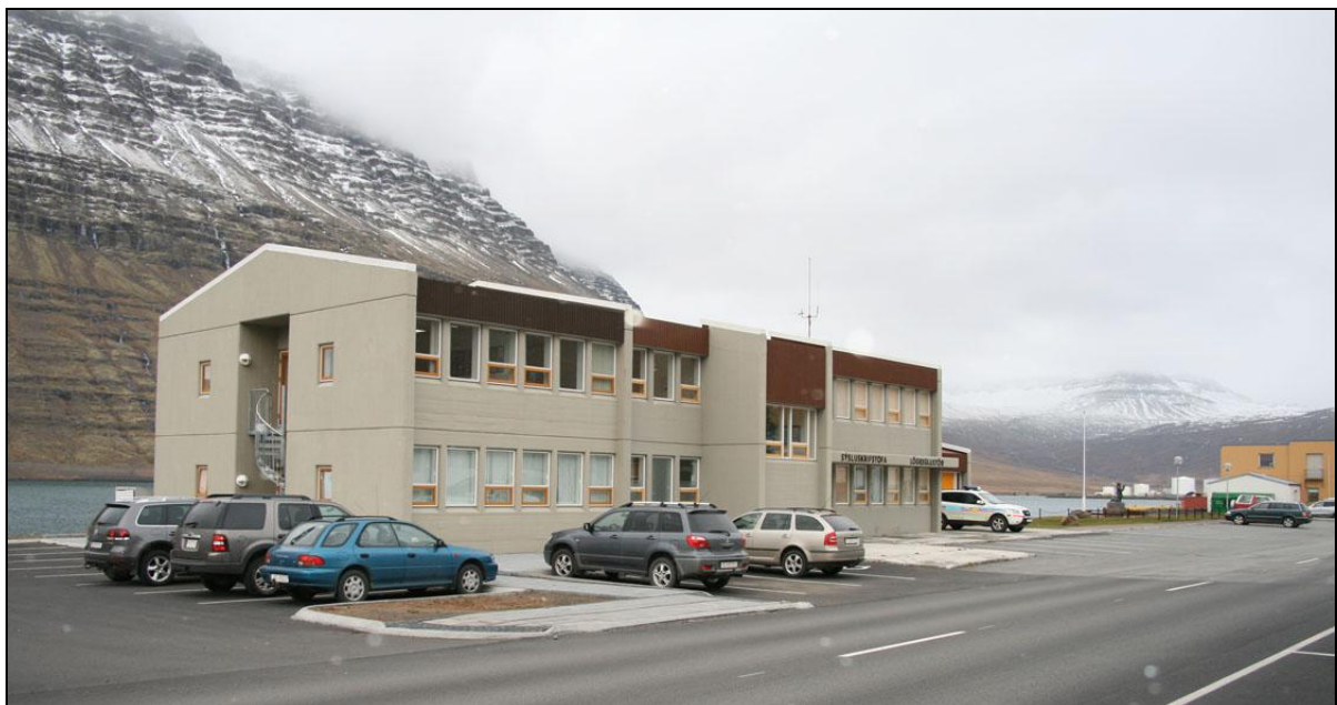
Aðstaða Sýslumannsins á Eskifirði með fullfrágenginni viðbyggingu og lóðarfrágangi.