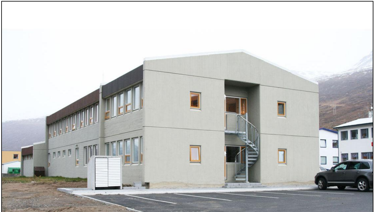
Nýja viðbyggingin, norðurhornið.

Lokaúttekt og ábyrgðarúttekt voru framkvæmdar samhliða 30. ágúst 2008.