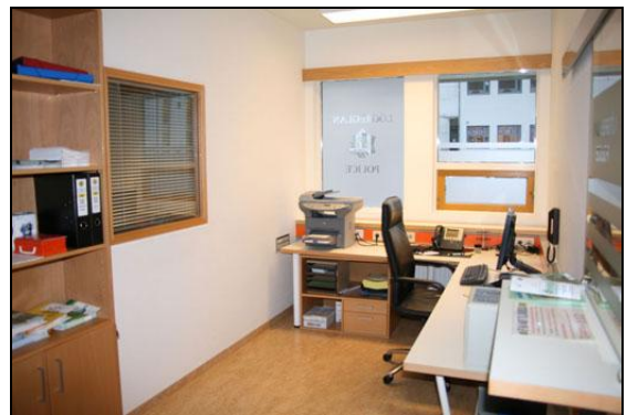
Lögregluvarðstofan eftir breytingar.

Framkvæmdunum lauk 30. ágúst 2008 með verklokaúttekt og sátt um að verktaki gæfi afslætti af verksamningi bæði vegna ágalla og vanefnda, alls um 1 m.kr., og að Fasteignir ríkissjóðs sem rekstraraðili sæi um að ljúka þeim verkþáttum sem enn var ólukið m.a. fullnaðarfrágangi brunavarnakerfis hússins.