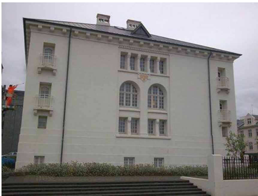
Mynd 1: Háprýstipvottur á norðurhlíð

Verkkaupi var forsætisráðuneytið. Beiðni barst Framkvæmdasýslu ríkisins í febrúar 2006 um aðstoð við að kanna ástand Þjóðmenningarhússins utanhúss og að leggja mat á þörf og umfang viðgerða og málningar á ytra byrði hússins. Verkefnastjóri hjá FSR var Sigurður Norðdahl.