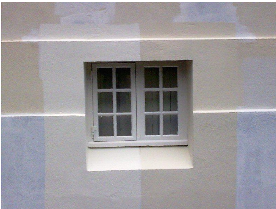
Mynd 2: Litaprufur

FSR benti auk þess á að erfitt myndi reynast að gera „varanlega“ við reyk háfana nema með vörn úr málmi eða öðrum veðurþolnum klæðningum, að hluta til yfir þá eða að öllu leyti.