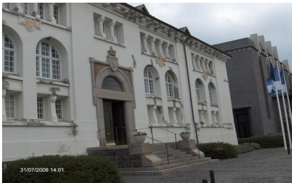
Mynd 8: Múrviðgerðir á suðurhlíð