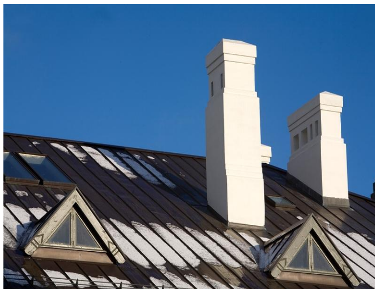
Mynd 5: Nýmálaðir skorsteinar eftir viðgerðir haustið 2008

Stefnt var að hefjast handa við viðgerð skorsteina ekki síðar en í annarri viku ágúst.