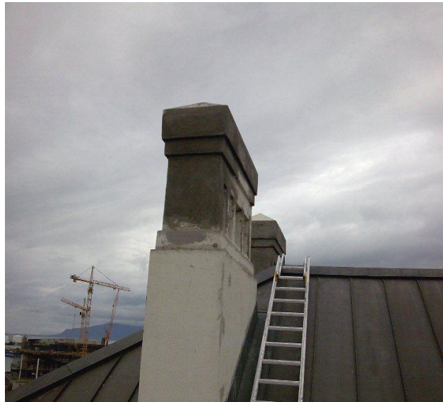
Mynd 3: Viðgerð skorsteina á vesturhlíð