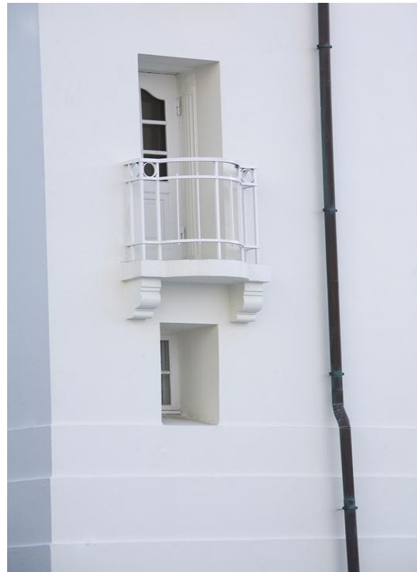
Mynd 6: Nýmálaður veggur, svalir, gluggar og niðurfall