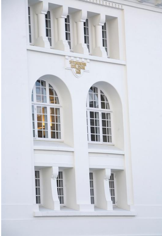
Mynd 7: Nýmálaður veggur, gluggar og veggskjöldur

Eftirlit með framkvæmdunum hafði Sigurður Norðdahl verkefnisstjóri hjá FSR og sá hann einnig um samskipti við hönnuði og starfsmenn Þjóðmenningarhússins. Lokaúttekt fór fram þann 28. ágúst 2008.