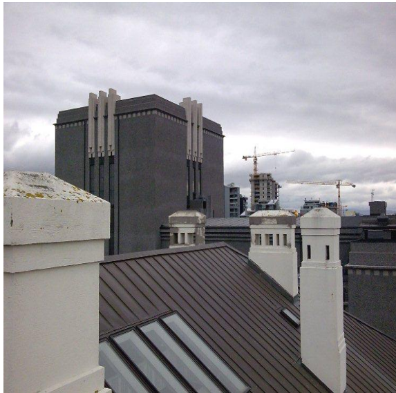
Mynd 4: Viðgerð skorseina á austurhlíð

Heildarkostnaðaráætlun FSR í mars 2008 nam 17,1 m.kr. Ástæða hækkunar frá frumkostnaðar-áætlun var í meginatriðum sú, að bætt var við viðgerð og málun á útigriðverki og járnhandriði á lóðarmörkum.