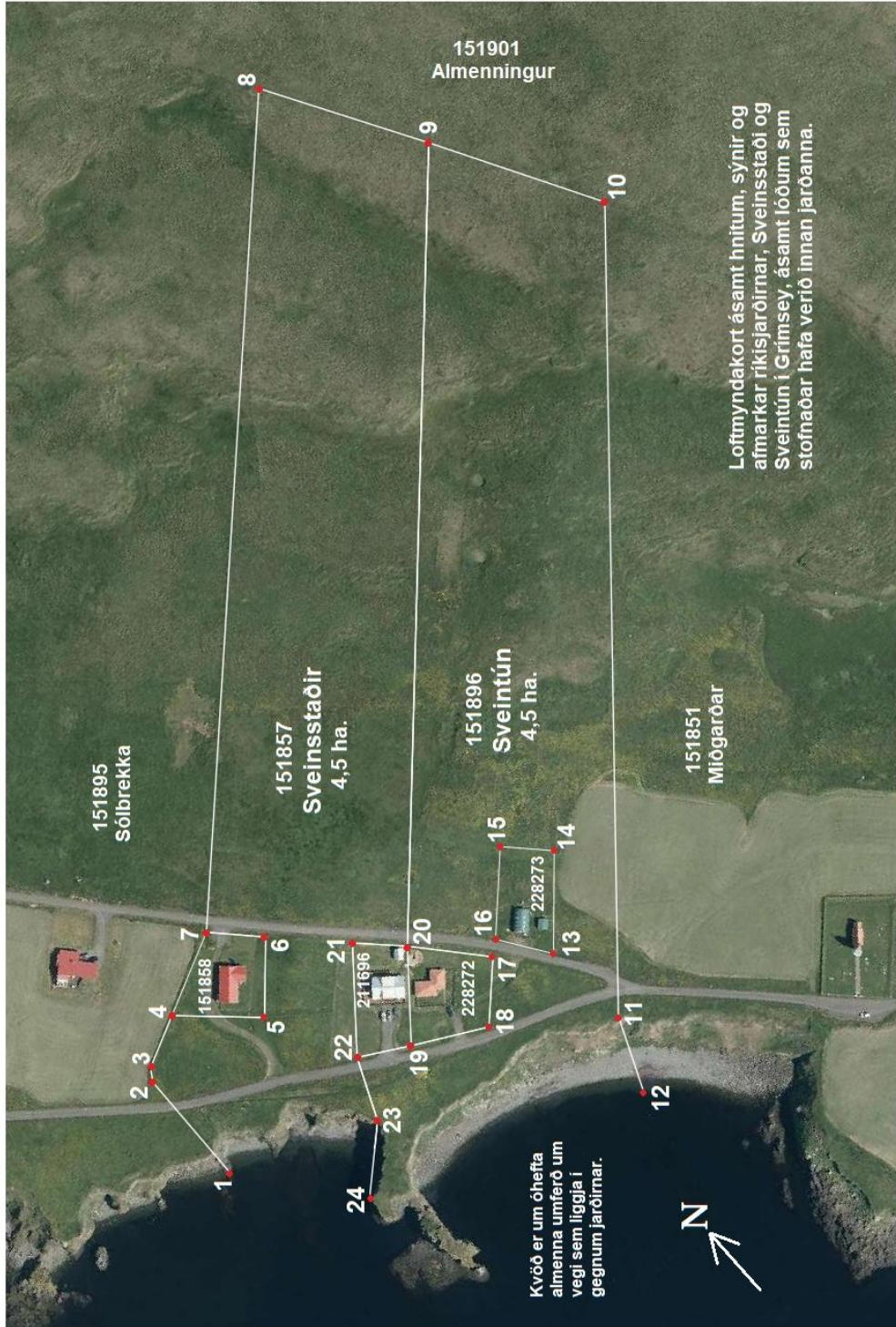
Lofmyndakort - Lofmyndir ehf.